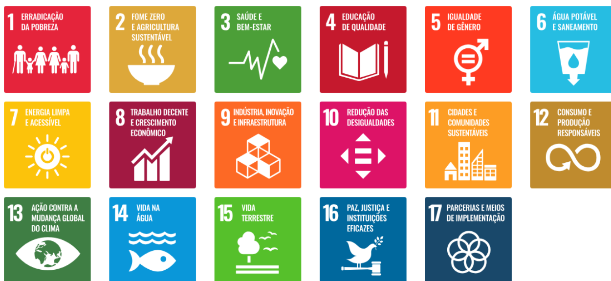
Título: Os Objetivos do Desenvolvimento Sustentável no Brasil