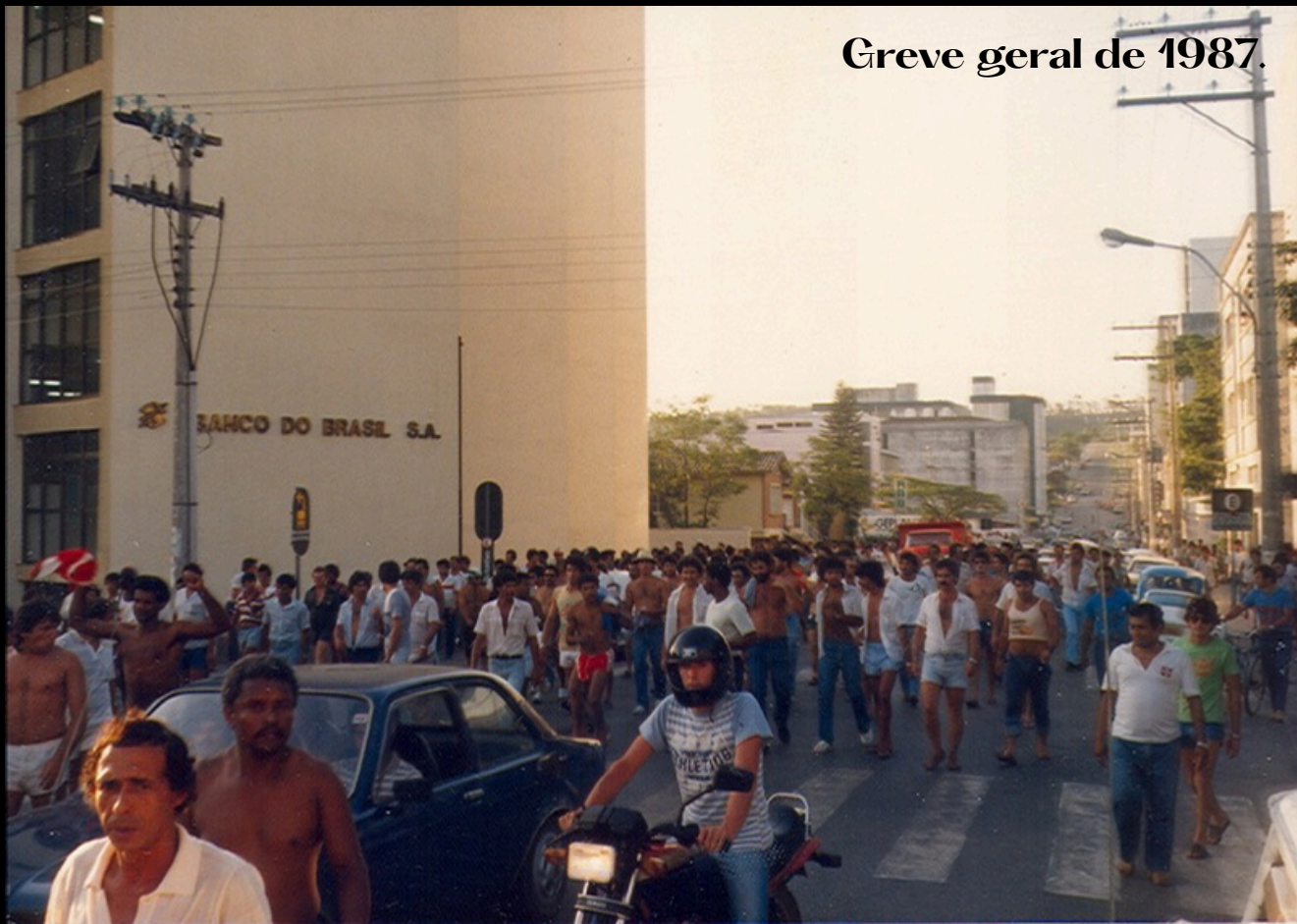
Greve geral de 1987.