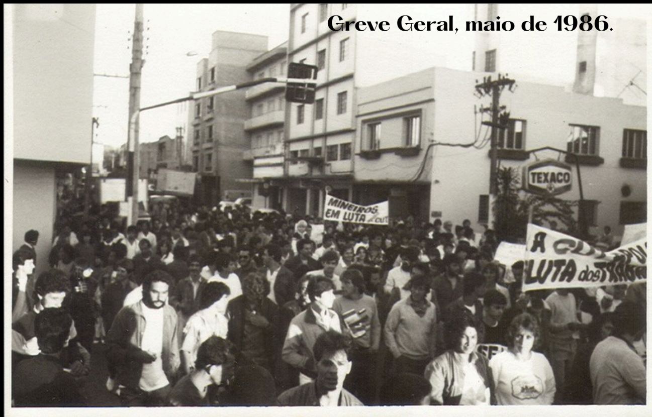
Greve Geral, maio de 1986.

O espaço permanece. Seu uso, porém, mudou.