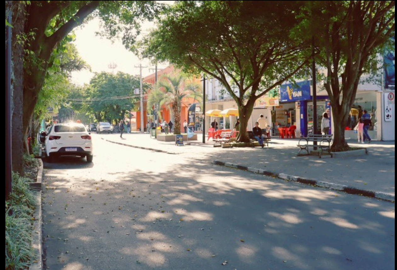
Acervo fotografico Cedoc, Gabrieli, 2025.