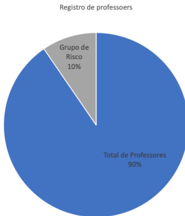
Figura 2 - Perfil dos docentes da UNESC em 2020/1.

ilustrativo , a figura 02 mostra uma representação simplificada dessa realidade.