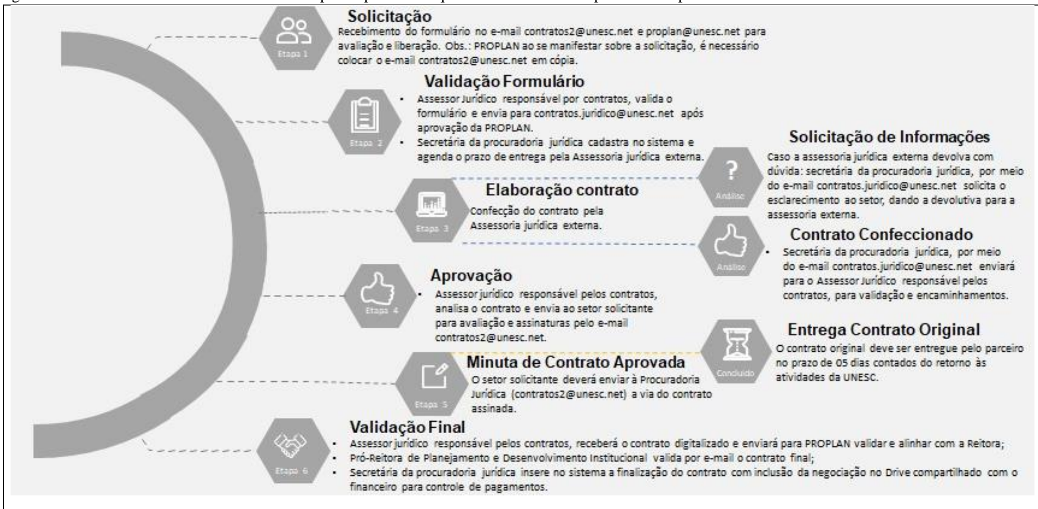
Figura 2 – Fluxo Interno dos contratos/convênios para o período de quarentena institucional por conta da pandemia Coronavírus.