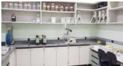
Equipamentos e materiais utilizados em Fitoterápicos e Farmacognosia