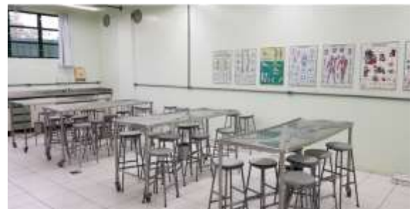
Laboratório de Anatomia II