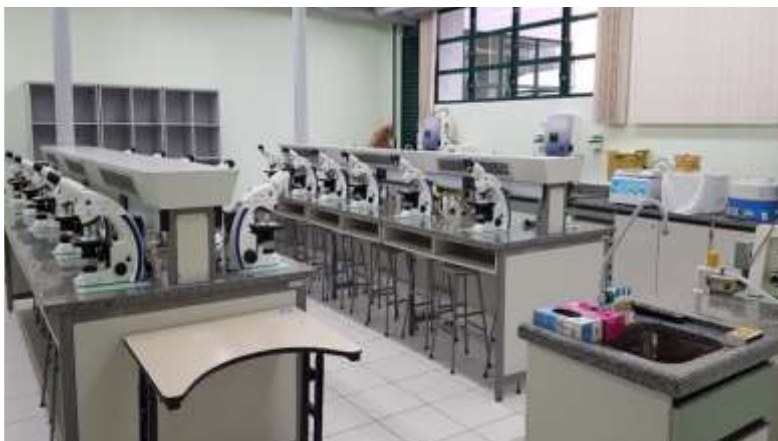
Laboratório de Parasitologia