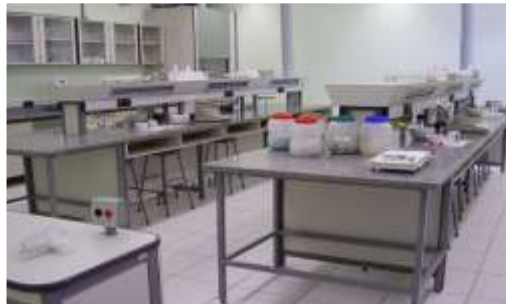
Laboratório de Farmacotécnica e Cosmetologia