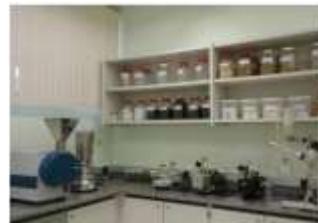
Equipamentos e materiais utilizados em Fitoterápicos e Farmacognosia