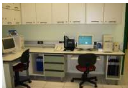
Sala de preparo do Laboratório de Química

Este ambiente serve de apoio para preparar as atividades práticas, bem como selecionar os materiais, preparar soluções, conservar reagentes, soluções químicas, realizar pesagens, incubar amostras, entre outras.