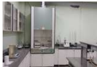
Equipamentos e materiais utilizados em Fitoterápicos e Farmacognosia