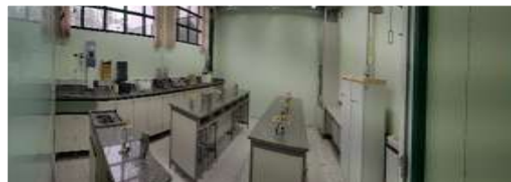
Laboratório de Bioquímica