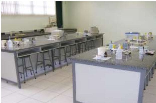
Laboratório de Bioquímica