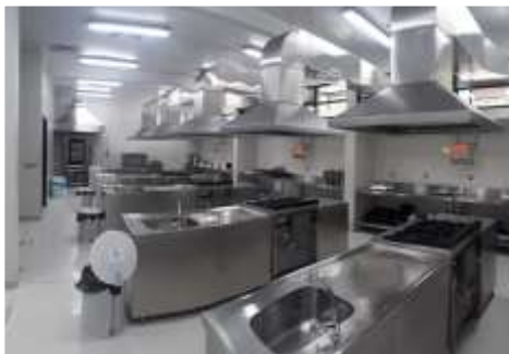
Laboratório de Nutrição e Dietética