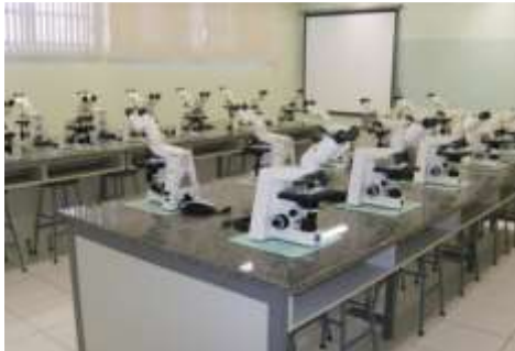
Laboratório de Microscopia