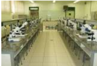
Laboratório de Farmacognosia, Fitoterápicos e Homeopatia