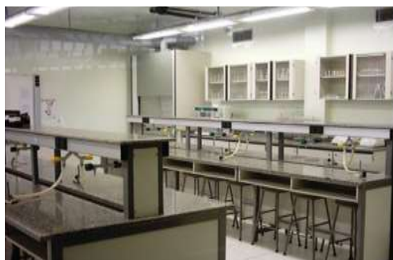
Laboratório de Tecnologia Farmacêutica