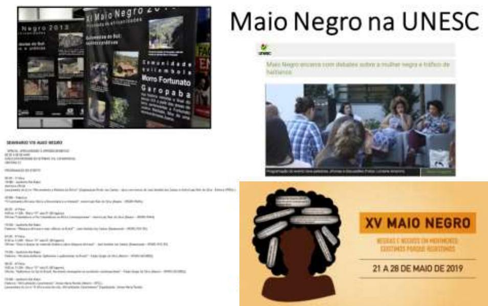
Figura 1: painel de atividades do Maio Negro - UNESC

subsidiar, as iniciativas de instâncias educacionais da região que estejam implantando projetos que levem em conta a questão da educação afro e indígena, bem como incentivar o início de desenvolvimento de projetos em unidades educacionais que não o tenham; Trazer para a Instituição as discussões que estão sendo feitas nas universidades do Brasil e na sociedade em geral; Sensibilizar a sociedade criciunense para a importância do efetivo desenvolvimento da referida temática nos currículos escolares; Apresentar materiais didáticos que ampliem a discussão em sala de aula acerca do assunto (Figura 1).