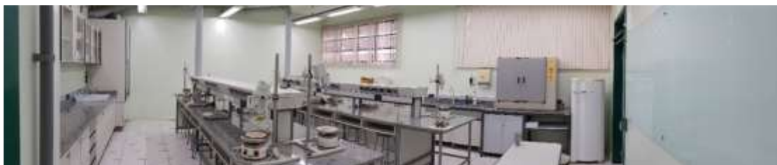
Laboratório de Farmacotécnica e Cosmetologia