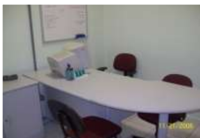
Laboratório de atendimento de Habilidades

Este ambiente destina-se a receber professores e acadêmicos dos diversos cursos de graduação e pós-graduação da área da saúde, agendar aulas e estudos a serem realizadas nos Laboratórios de Habilidades, Morfofuncional e Técnica Operatória, realizar atividades administrativas, informar as normas de funcionamento dos laboratórios, bem como acesso ao laboratório, empréstimo de equipamentos e materiais, normas de biossegurança, entre outros.