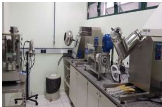
Laboratório de Tecnologia Farmacêutica