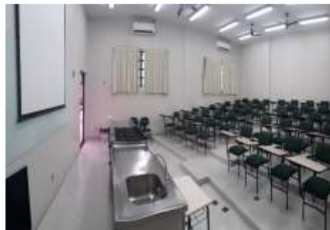
Auditório do Laboratório de Nutrição e Dietética