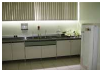
Sala de preparo do Laboratório de Química