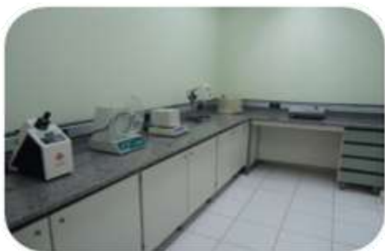
Laboratório de controle de qualidade de medicamentos