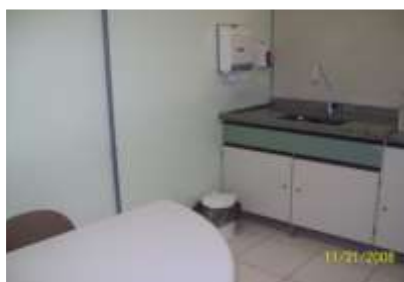
Laboratório de atendimento de Habilidades