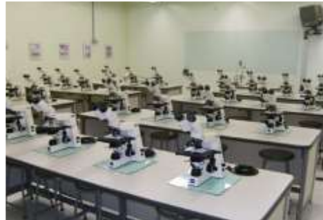
Laboratório de Microscopia