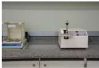
Equipamentos e materiais utilizados em Fitoterápicos e Farmacognosia