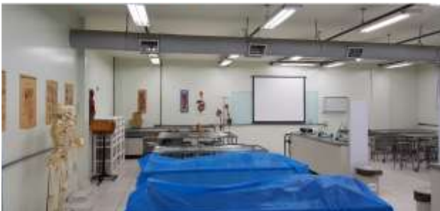
Laboratório de Anatomia I