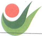
TABELA DE ATIVIDADES DE FORMAÇÃO COMPLEMENTAR