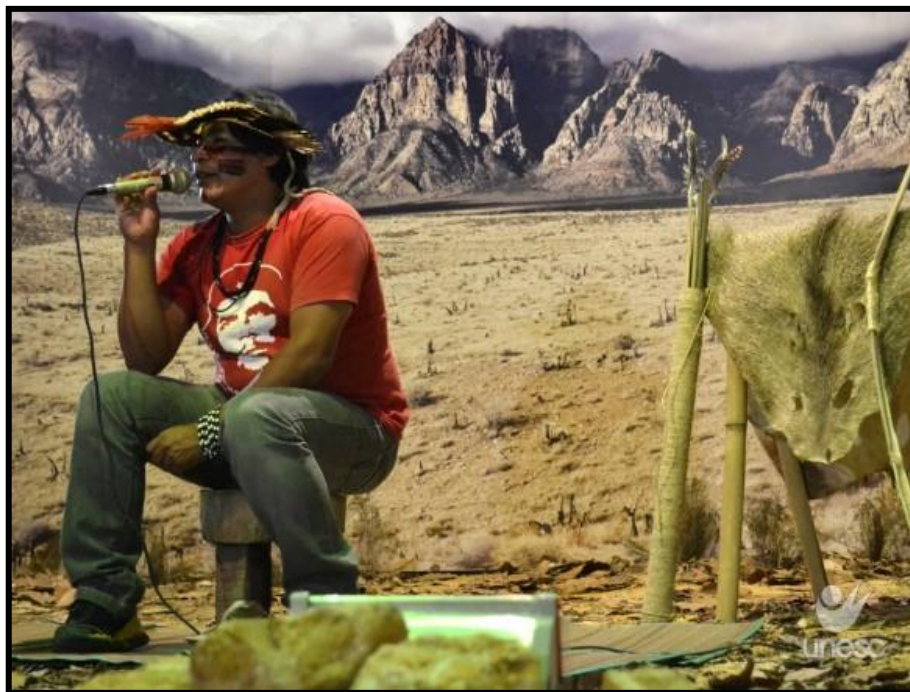
Figura 8 - Relato de Vida de Indígena para Escolares da Região, Docentes, Discentes e Funcionários na UNESC