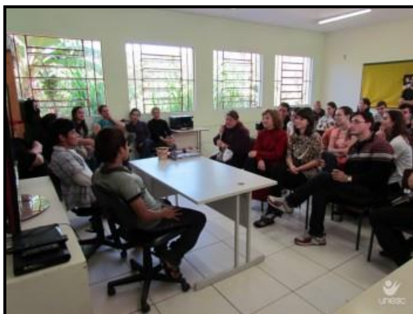
Figura 5 - Palestra de Indígena Guarani para Acadêmicos, Docentes e Funcionários na I Semana Indígena da UNESC