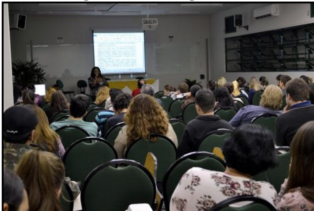
Figura 2 - Folder do XI Maio Negro na UNESC