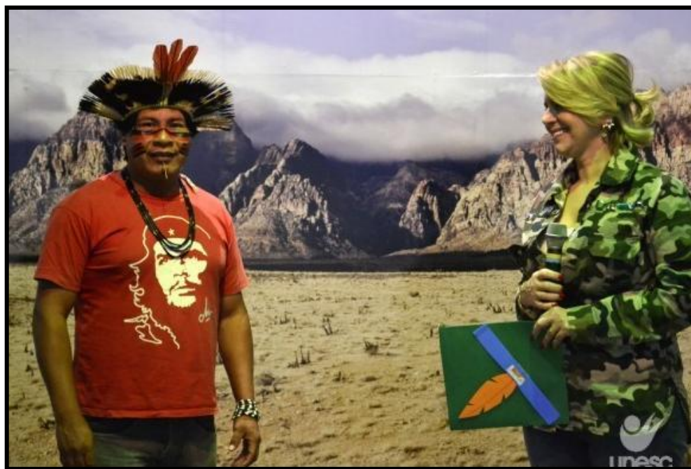
Figura 6 - Entrevista com Indígena em Socialização com Escolares da Região, Docentes, Discentes e Funcionários na UNESC