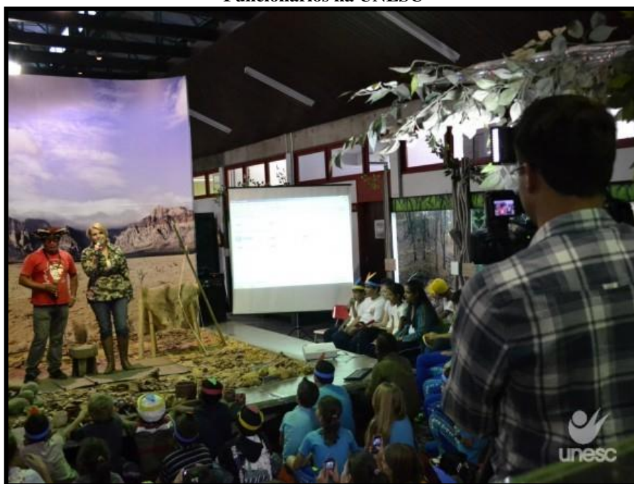
Figura 7 - Entrevista com Indígena em Socialização com Escolares da Região, Docentes, Discentes e Funcionários na UNESC