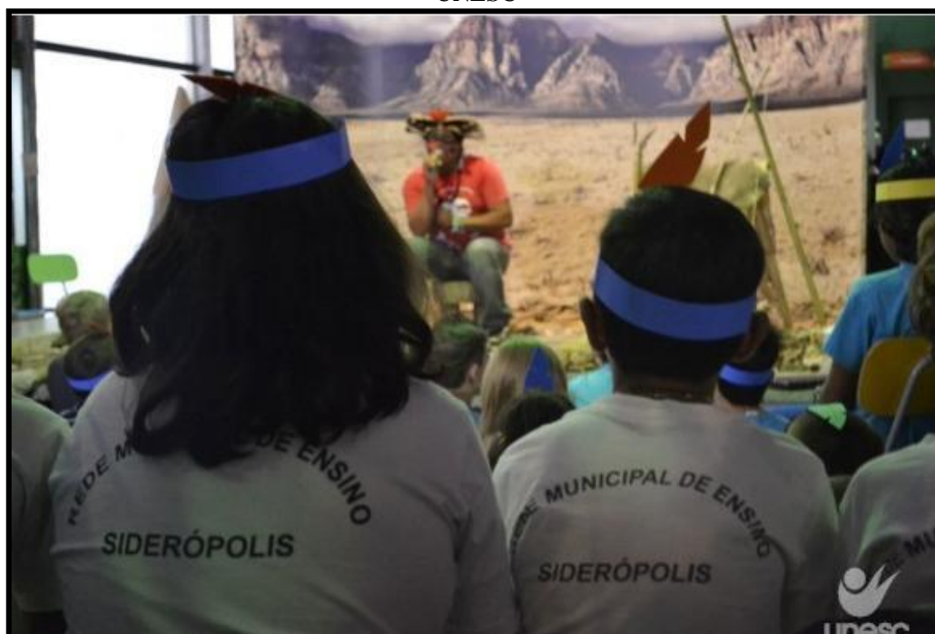
Figura 9 - Relato de Vida de Indígena para Escolares da Região, Docentes, Discentes e Funcionários na UNESC