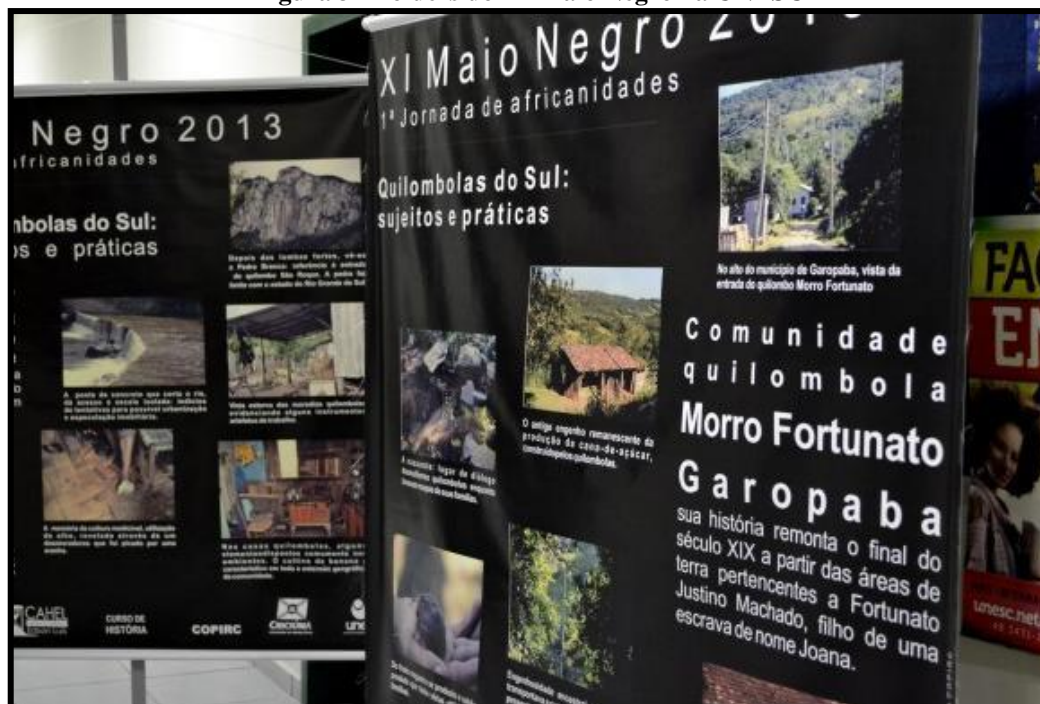
Figura 3 - Folders do XI Maio Negro na UNESC