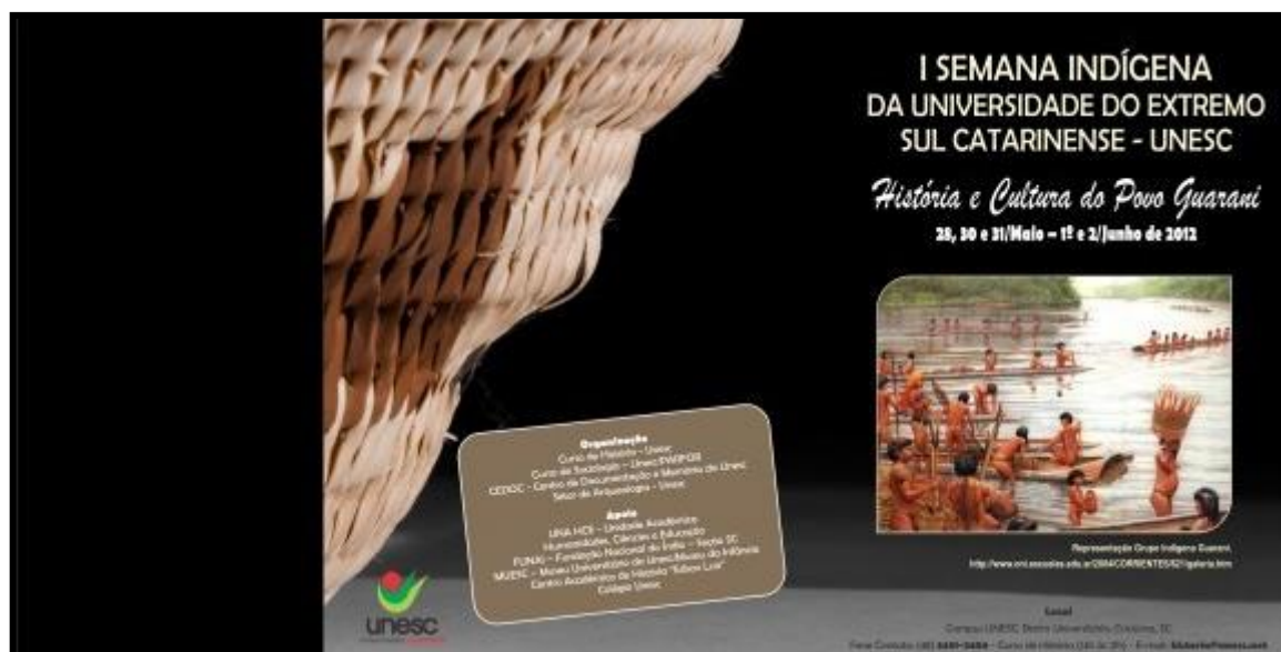
Figura 4 - Folder do Evento I Semana Indígena da UNESC