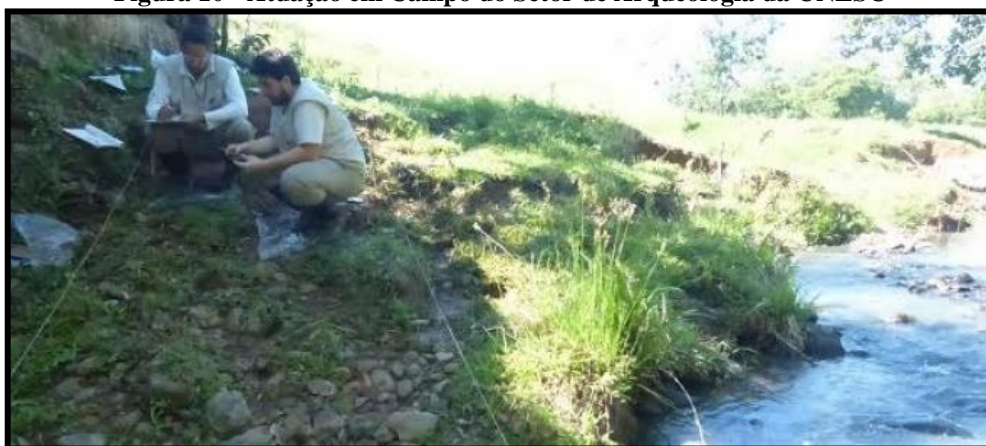
Figura 10 - Atuação em Campo do Setor de Arqueologia da UNESC