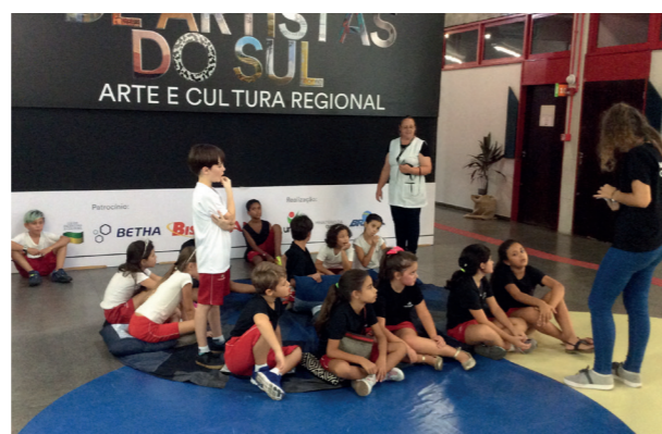
Mediação Cultural com Estudantes