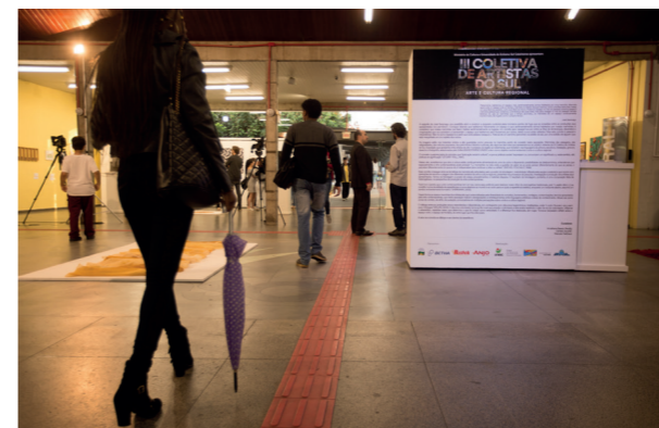
Painel com dados curatoriais da exposição

Pessoas Jurídicas: 4% do Imposto devido Dados para depósito: Banco do Brasil Ag.: 3422-3 Conta de Captação: 5658-8 Código identificador 1 = CNPJ Código identificador 2 = 1 Código identificador 3 = Deixar em branco