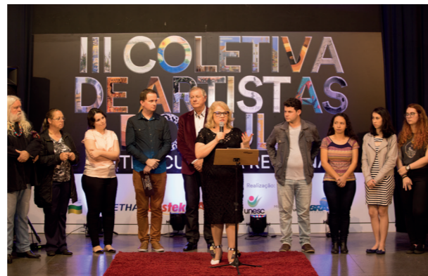
Cerimonial de abertura com artistas envolvidos