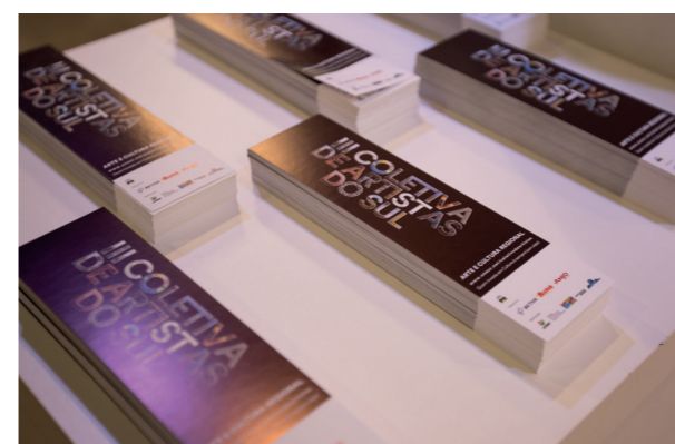
Marcadores de páginas distribuídos para o público

Pessoas Físicas: 6% do imposto devido Dados para depósito: Banco do Brasil Ag.: 3422-3 Conta de Captação: 5658-8 Código identificador 1 = CPF Código identificador 2 = 1 Código identificador 3 = Deixar em branco