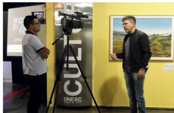
Gravação de DVD para distribuição em Escolas Públicas

31 de outubro de 2019 a 10 de março de 2020 com exposição coletiva, com visitas mediadas e palestras.