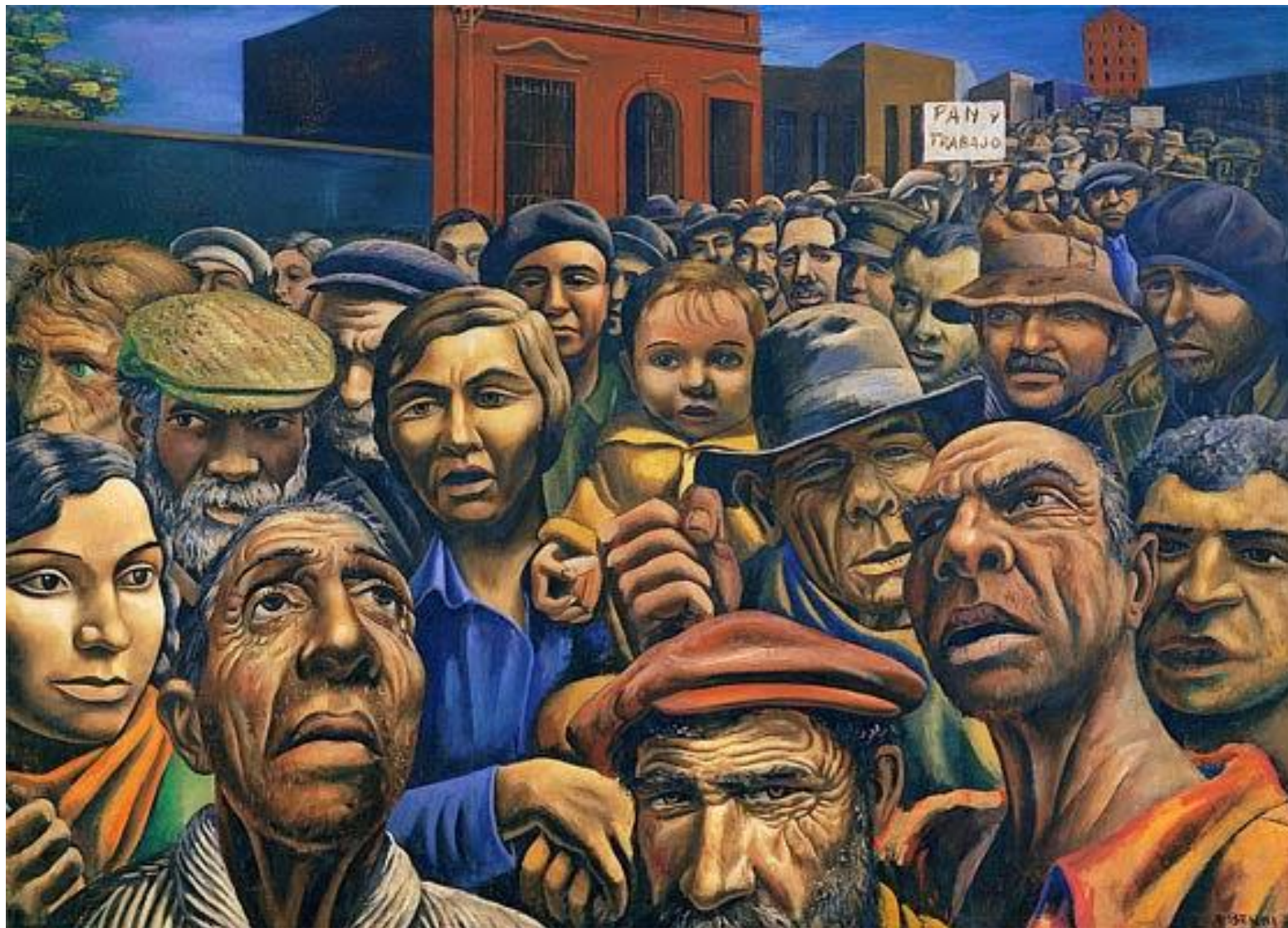
ANTÔNIO BERNI (1905 - 1981) – “MANIFESTACIÓN” (1934)